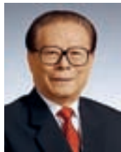
Jian Zemin é procurado pelas suas políticas "contra a humanidade", como a esterilização forçada das mulheres tibetanas.

O mandato de captura da justiça espanhola a antigos líderes chineses fez ontem estalar uma mini-crise diplomática entre os dois países. Pequim comunicou ontem às autoridades espanholas o seu "forte mal-estar" com o facto da Audiencia Nacional, principal tribunal de Espanha, ter emitido um mandato internacional de busca e captura contra o ex-presidente chinês Jiang Zemin, de 87 anos, o antigo primeiro-ministro Li Peng, de 86 anos, e ainda sobre outros membros da liderança do Partido Comunista Chinês, pelo seu papel no genocídio no Tibete. As associações tibetanas saudaram o "apego dos juízes espanhóis aos princípios" e não aos cálculos políticos.